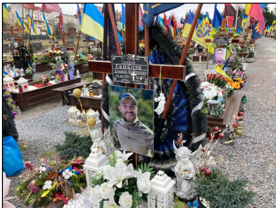
Kirkegården i Lviv

Og så har jeg, så snart jeg nævnte, at jeg er fra Danmark, mødt en meget stor taknemmelighed over for den hjælp, Danmark yder. Ukrainerne er helt bevidste om, at de er afhængige af hjælp udefra. Samtidigt var det en tak, udtrykt så indtrængende, at det var umuligt ikke at blive berørt. En følelse af, at det ikke alene er et spørgsmål om støtte fra regering til regering, men meget personligt.