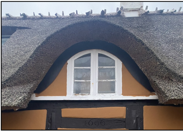
På bjælken under vinduet står årstallet 1696

rører sig i lokalområdet. Espen var sidste sommer til ølsmagning ved Skeby Gymnastikforenings sportsfest, og de kommer begge cirka en gang om måneden i Skalleværket i Klintebjerg.