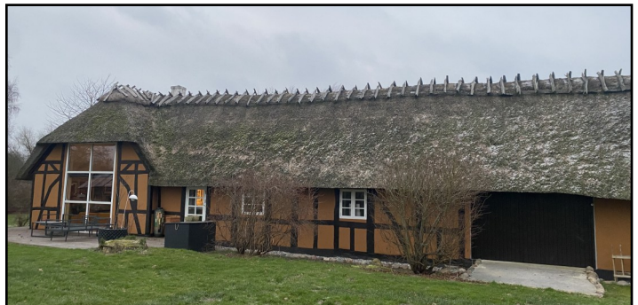
Den side af gården, der vender ud mod haven