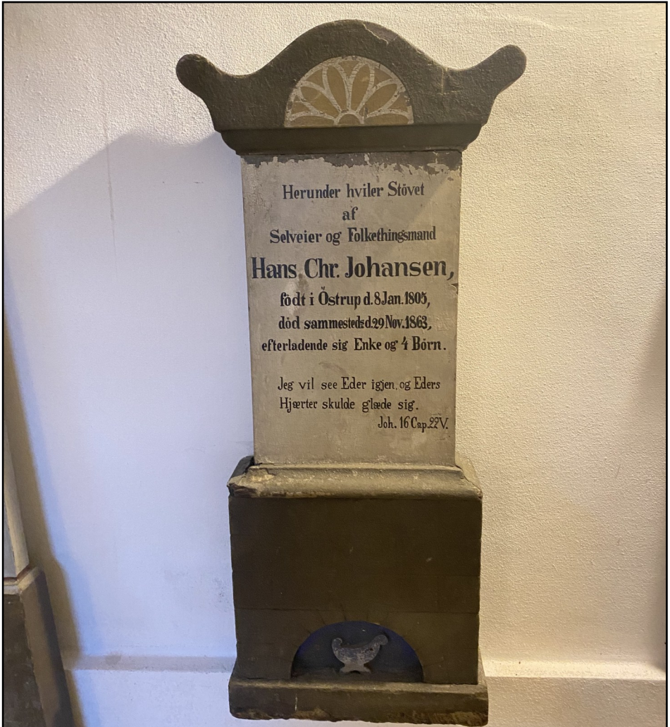
Gravsten af træ i Østrup kirkes våbenhus - se artikel om gravsten side 2

Kongens nytårstale Rejsehold og lysglobe