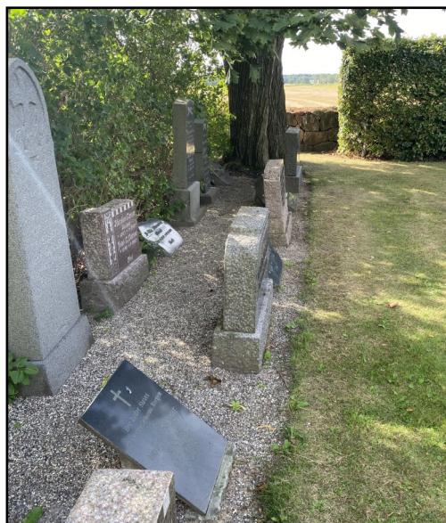
Gamle gemte gravsten på Skeby kirkegård

Men så er der alle de gamle gravsten, der ikke er bevaringsværdige, og som især på Skeby kirkegård er stillet op i lange lige rækker. Mon de sten har betydning for dig, kære læser? Er det mon sten, som du opsøger, eller hvad tænker du om dem? Dette ønsker menighedsrådet at blive klogere på. SKRIV DERFOR MEGET GERNE DIT SVAR til mig, der har skrevet artiklen, på kha@km.dk