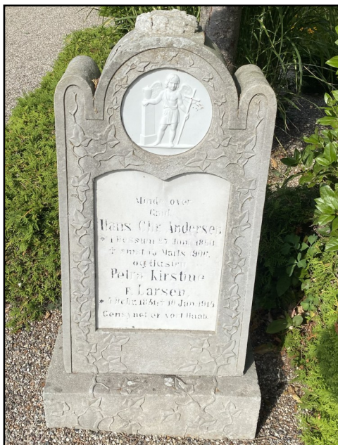
Bevaringsværdig gravsten på Skeby kirkegård

Nogle af de gravsten, der står på kirkegårdene ved Østrup, Skeby og Gerskov kirker er meget gamle. Sommetider er der ikke længere nogen, der betaler til gravstedet, men stenene kan være så specielle eller så gamle, at de fortsat står på kirkegården.