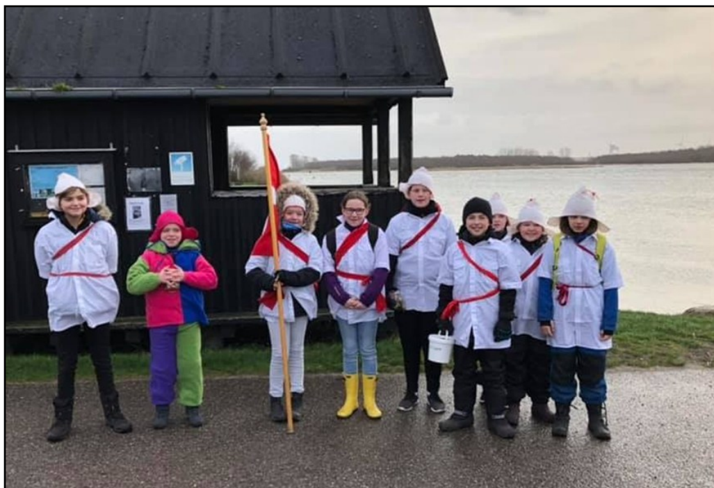
Fastelavns-soldater i Klintebjerg, februar 2020